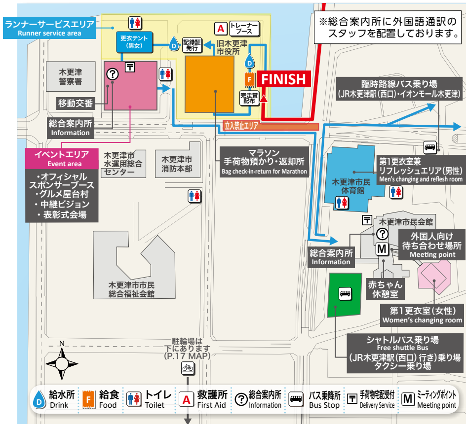
— マラソンコース (Marathon Course) — フィニッシュ後の経路 (Route After Finish) — ランナー専用エリア (Runners Only)